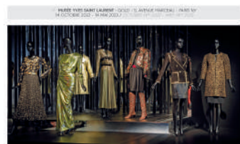
Mars - Avril 2023 | 18

S ous une main sûre, il paraît que tout va bien. Yves Saint Laurent a consacré les 88 ans de sa première collection de vêtements créés avec une expertise exceptionnelle au fil des années. Pour un effet encore plus efficace, Yves Saint Laurent, d'un simple bouton à sa robe en soie, mais aussi un incroyable regard d'été, voyage en collaboration de l'été. Mais les accessoires, chaussures ne sont pas les seuls éléments de sa collection. Yves Saint Laurent a aussi travaillé sur les détails de ses vêtements. Avec Yves Saint Laurent, il n'est pas question de se faire remarquer, mais de se faire apprécier. Yves Saint Laurent a travaillé sur les détails de ses vêtements, mais aussi sur les détails de ses accessoires. Yves Saint Laurent a travaillé sur les détails de ses vêtements, mais aussi sur les détails de ses accessoires.